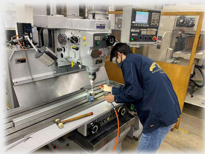
図1:フレーム班 治具製作の様子

また、並行して2月から本格的に始まる製作に向けての準備を進めており着々と部材が届いている状況です。図1はフレーム班治具製作の様子です。